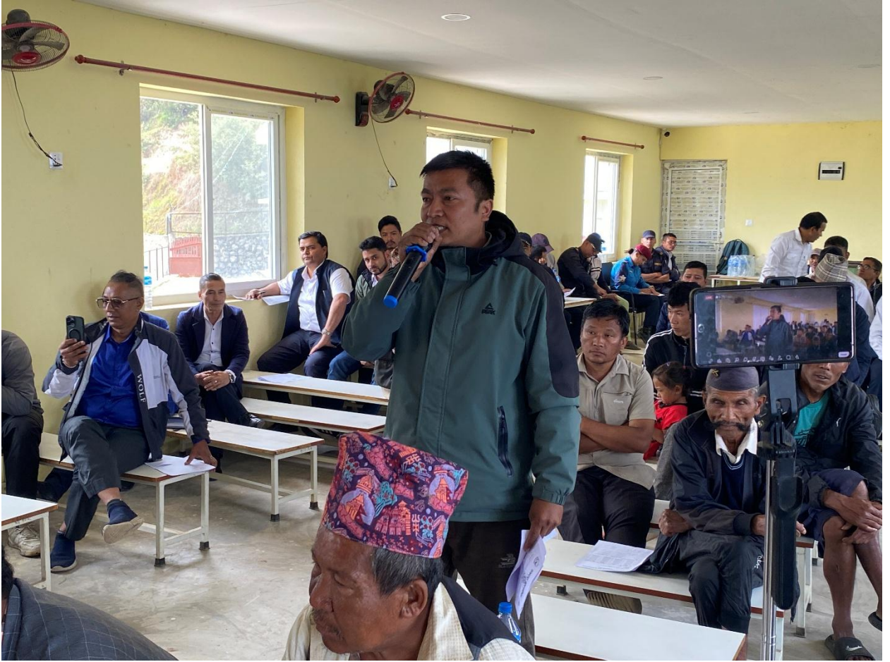
सार्वजनिक सुनुवाई कार्यक्रमका सहभागीहरु

यसका अतिरिक्त सार्वजनिक सुनुवाई कार्यक्रमले नागरिकको सूचनाको हकलाई व्यवहारमा कार्यान्वयन गर्ने प्रभावकारी माध्यमको रूपमा समेत काम गरेको छ । नगरपालिकाले सञ्चालन गरेका कार्यक्रम, बजेट खर्च, योजना कार्यान्वयनको अवस्था तथा सेवा प्रवाहसम्बन्धी विवरण नागरिकसमक्ष खुला रूपमा प्रस्तुत गरिनुले पारदर्शिता प्रवर्द्धन गर्नुका साथै सुशासन कायम गर्न समेत सकारात्मक योगदान पुगेको छ ।